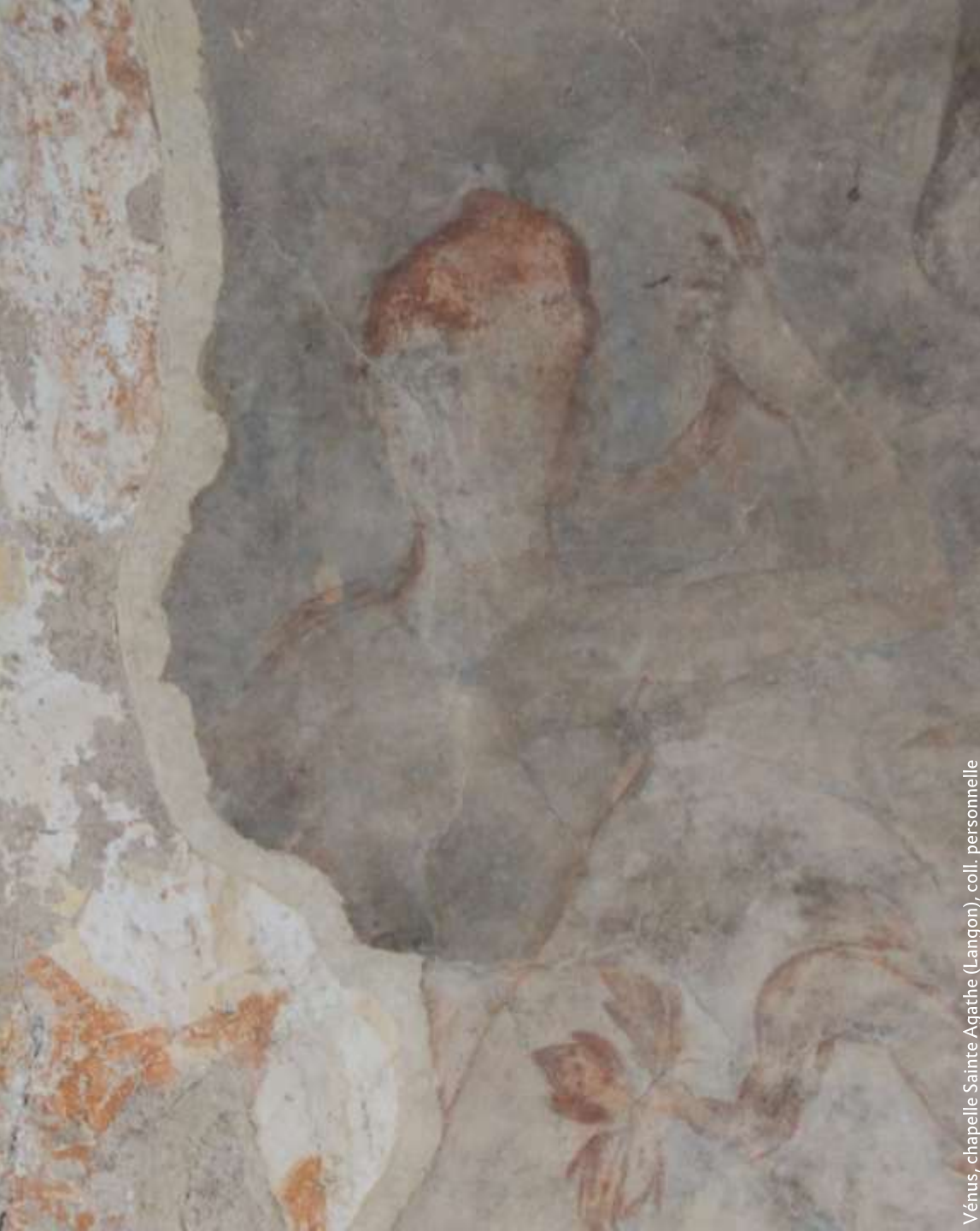
Vénus, chapelle Sainte Agathe (Langon)