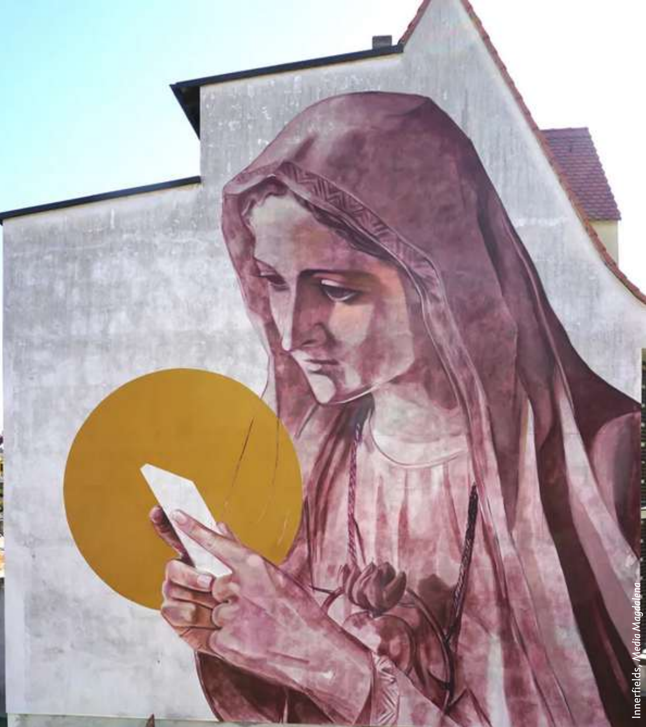
Innerfields, Media Magdalena